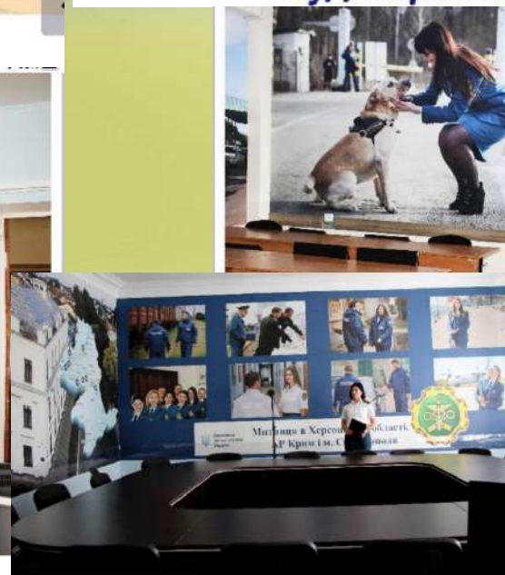
Аудиторія Херсонська митниця