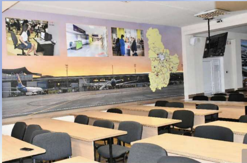
Аудиторія Київська митниця