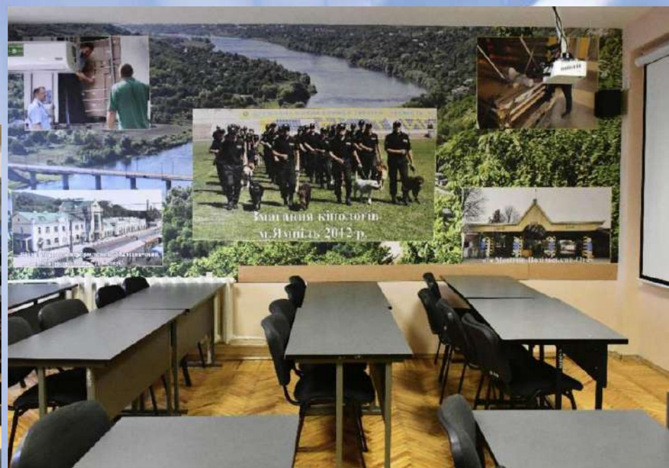
Аудиторія Вінницька митниця