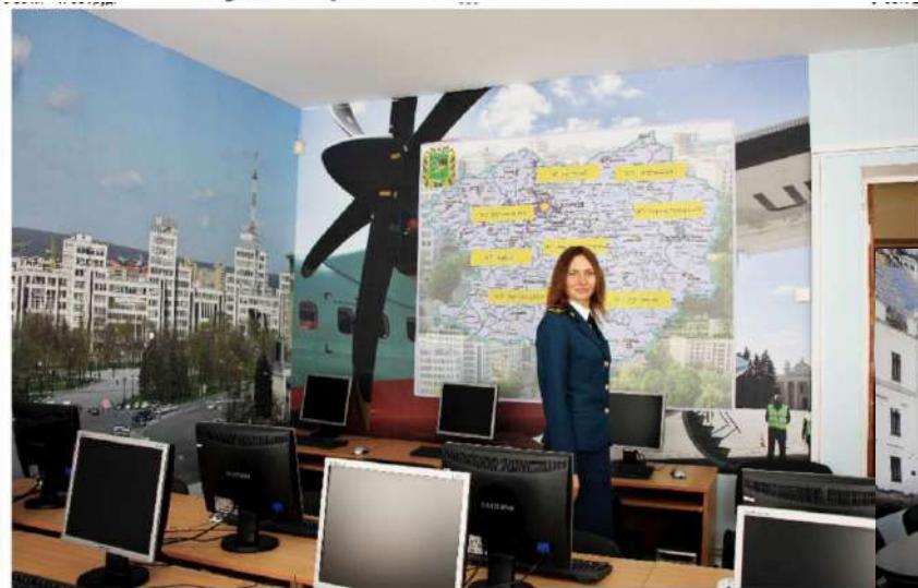
Комп'ютерний клас. Харківська митниця